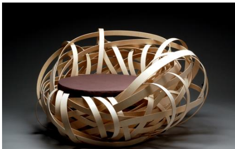
« Vegetal chair » Les frères Bouroullec 2009